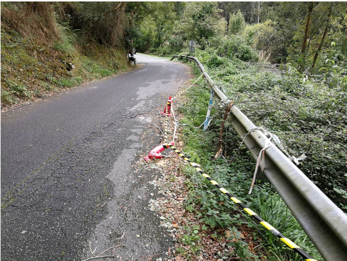
Situación actual. La maleza no deja ver la situación real de la falla.

Obviamente, la situación no ha mejorado, lo que era fácil de arreglar en un principio, supone ahora una costosa reparación.